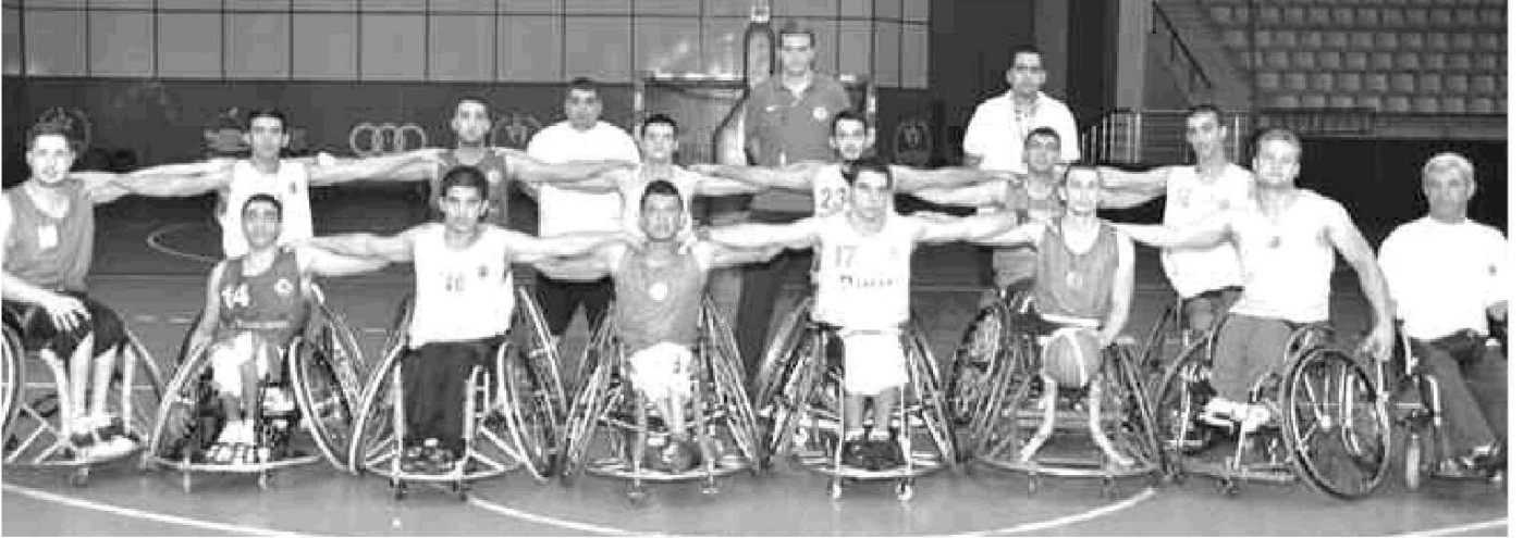
Tekerlekli Sandalye Basketbol Genç Milli Takımı, 5-15 Eylül tarihleri arasında yapılacak Dünya Şampiyonasına Adana'da hazırlanıyor.